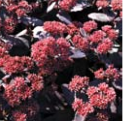
FETTHENNE Sedum telephium 'Black Beauty®' dunkelrot, schwarzes Laub, wertvolle Schnittstaude ☼ Aug.-Sept. ↑ 40 cm