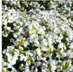
GÄNSEKRESSE Arabis caucasica 'Schneehaube' weiß, kompakte Sorte, winter-/ immergrün