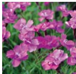
PFINGSTNELKE Dianthus gratianopolitanus 'Eydangeri' violettrosa, winter-/immergrün