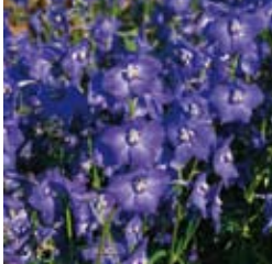
RITTERSPORN Delphinium x belladonna 'Atlantis' dunkelviolettblau, wertvolle Schnittstaude ☼ Juli-Aug. ↑ 100 cm