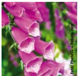
FINGERHUT Digitalis purpurea 'Gloxiniaeflora' rosarote Farbmischung, großblumig, winter-/immergrün ☀ Juni–Juli ↑ 150 cm