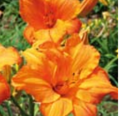
TAGLILIE Hemerocallis x hybrida 'Mauna Loa' orange, gelber Schlund, auffallende Farbe ☼ Juni-Juli ↑ 60 cm