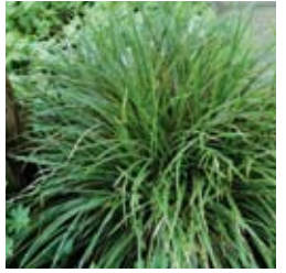
JAPAN-SEGGE Carex morrowii 'Variegata' dunkelgrünes Blatt mit hellem Rand, winter-/immergrün ☀ Juni–Juli ↑ 40 cm