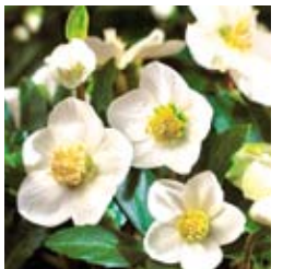
CHRISTROSE Helleborus niger weiß, kalkhaltiger Boden, winter-/ immergrün, wertvolle Schnittstaude ☀ März–April ↑ 30 cm