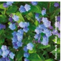
GEDENKEMEIN Omphalodes verna blau, beliebter Bodendecker ☀ April–Mai ↑ 20 cm