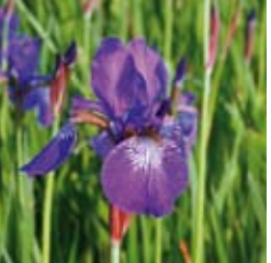
SCHWERTLILIE Iris sibirica 'Caesar' dunkelblauviolett, wertvolle Schnittstaude ☼ Mai-Juni ↑ 70 cm