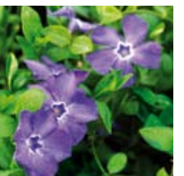
IMMERGRÜN Vinca minor 'Marie®' violettblau, flacher gleichmäßiger Wuchs, winter-/immergrün ☀ April–Mai ↑ 10 cm