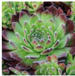
DACHWURZ Sempervivum x hybridum rosa bis rot, verschiedene Rosetten, winter-/immergrün