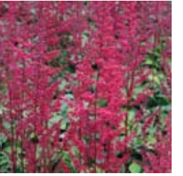
PRACHTSPIERE Astilbe x arendsii 'Fanal' dunkelrot, kompakt, dunkles Laub, wertvolle Schnittstaude ☀ Juli–Sept. ↑ 60 cm