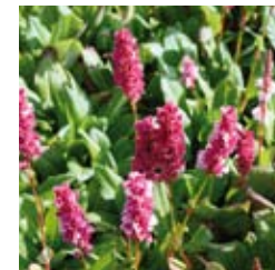
TEPPICH-KNÖTERICH Bistorta affinis 'Kabouter' rosa, guter Bodendecker