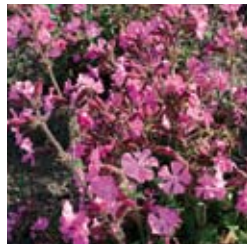
LEIMKRAUT Silene x robotii 'Rolley's Favourite®' rosa, reichblühend