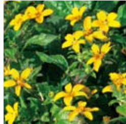
GOLDKÖRNBCHEN Chrysogonum virginianum tiefgelb, Dauerblüher, wertvoller Bodendecker