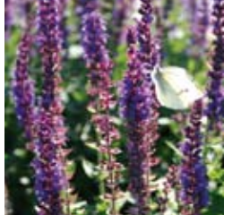
BLÜTEN-SALBEI Salvia nemorosa 'Ostfriesland' violett, besonders schöne Rabattenstaude ☼ Juni-Sept. ↑ 45 cm