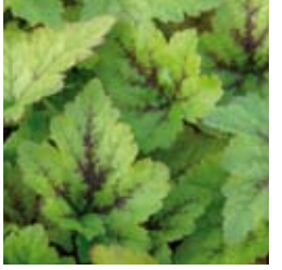
SCHAUMBLÜTE Tiarella cordifolia 'Tiger Stripes' weiß, grünes Blatt mit schwarzen Streifen, winter-/immergrün ☀ April–Mai ↑ 20 cm