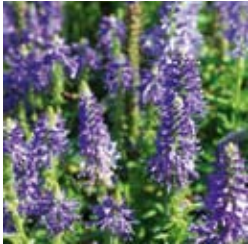
EHRENPREIS Veronica spicata 'Blauteppich' leuchtendblau