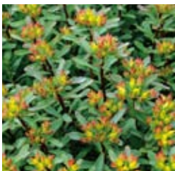
MAURPFEFFER Sedum floriferum 'Weihenstephaner Gold' goldgelb, wichtiger Bodendecker, winter-/ immergrün