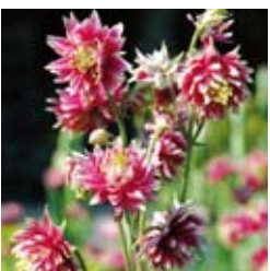
KURZSPORNIKE AKELEI Aquilegia vulgaris 'Nora Barlow' rosa, gefüllt, wertvolle Schnittstaude ☼ Mai-Juli ↑ 60 cm