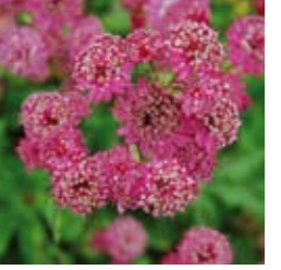
STERNDOLDE Astrantia major 'Abbey Road®' dunkelrot, wertvolle Schnittstaude ☀ Juli–Aug. ↑ 60 cm