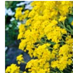
STEINKRAUT Alyssum saxatile 'Goldkugel' tiefgelb, duftend, winter-/immer- grün