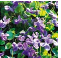
DUFT-VEILCHEN Viola odorata 'Königin Charlotte' blauviolett, reichblühend, wertvolle Schnittstaude ☀ März–April ↑ 15 cm