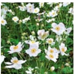
HERBST-ANEMONE Anemone japonica 'Honorine Jobert' reinweiß, wertvolle Schnittstaude ☀ Aug.–Okt. ↑ 80 cm