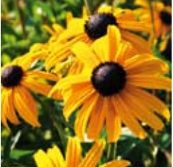
SONNENHUT Rudbeckia fulgida var. sullivantii 'Goldsturm' tiefgelb ☼ Juli-Okt. ↑ 60 cm