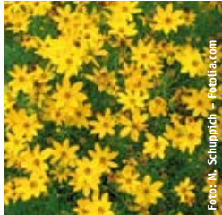
MÄDCHENAUGE Coreopsis verticillata 'Zagreb' tiefgelb, reichblühend, wertvolle Schnittstaude ☼ Juni-Sept. ↑ 30 cm