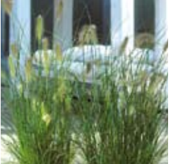
FEDERBORSTENGRAS Pennisetum alopecuroides 'Hameli' gelbbräunlich, früh, reichblühend, wertvolle Schnittstaude ☼ Juli-Okt. ↑ 60 cm