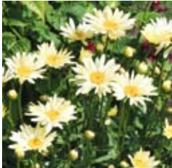
MARGERITE Leucanthemum x superbum 'Broadway Lights®' hellgelb, einfach ☼ Juli-Aug. ↑ 60 cm