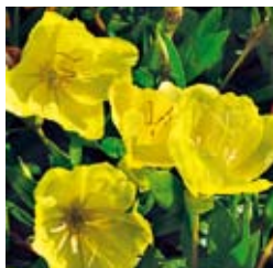
NACHTKERZE Oenothera macrocarpa (syn. missouriensis) gelb, niederliegende Triebe