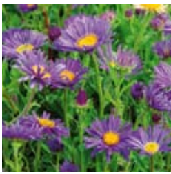
ALPEN-ASTER Aster alpinus 'Dunkle Schöne' dunkelviolett