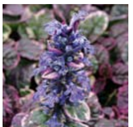
GÜNSEL Ajuga reptans 'Burgundy Glow' violettblau, grün-rosa-weißes Blatt, schwachwüchsig, winter-/immergrün ☀ April–Mai ↑ 15 cm