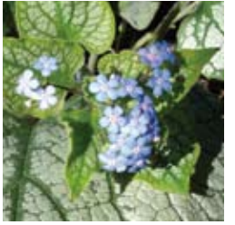
KAUKASUSVERGISSMEINNICHT Brunnera macrophylla 'Jack Frost®' blau, silbrigweißes Laub, Blattschmuckstaude ☀ April–Mai ↑ 50 cm