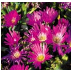
MITTAGSBLUME Delosperma sutherlandii violettrosa, wärmeliebend