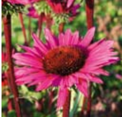
SONNENHUT Echinacea purpurea 'Fatal Attraction®' rosarot, wertvolle Schnittstaude ☼ Juli-Sept. ↑ 75 cm