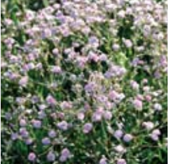
SCHLEIERKRAUT Gypsophila paniculata 'Bristol Fairy' weiß, gefüllt, wertvolle Schnittstaude ☼ Juli-Aug. ↑ 100 cm