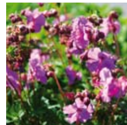
STORCHSCHNABEL Geranium x cantabrigiense 'Berggarten' purpurrosa, reich- blühend, winter-/immergrün