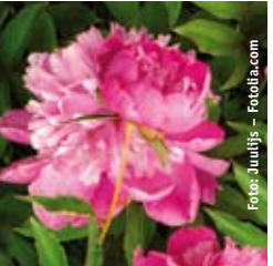
PFINGSTROSE Paeonia lactiflora 'Karl Rosenfeld' purpurrot, gefüllt, wertvolle Schnittstaude ☼ Mai-Juni ↑ 80 cm