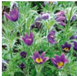
KUHSCHELLE Pulsatilla vulgaris violett, Knospen behaart, schöner Samenstand