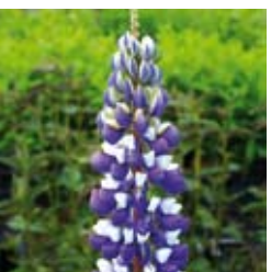
LUPINE Lupinus polyphyllus 'Kastellan' blau mit weißer Fahne, wertvolle Schnittstaude ☼ Juli-Aug. ↑ 100 cm