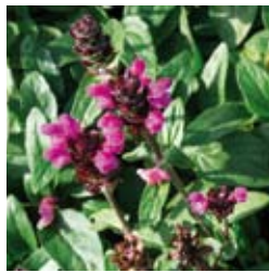
BRAUNELLE Prunella grandiflora 'Carminea' karminrosa