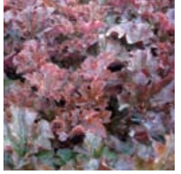
PURPURGLÖCKCHEN Heuchera micrantha 'Cappuccino' weiß, rotbraunes dunkles Blatt, winter-/immergrün ☀ Juli–Aug. ↑ 50 cm