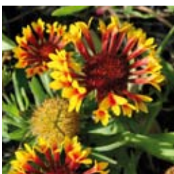
KOKARDENBLUME Gaillardia x grandiflora 'Fanfare®' gelbrot, röhrenartiges Blütenblatt, wertvolle Schnittstaude ☼ Juli-Sept. ↑ 50 cm