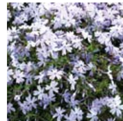
TEPPICH-FLAMMENBLUME Phlox subulata 'Emerald Cushion Blue' hellviolett, winter-/immergrün