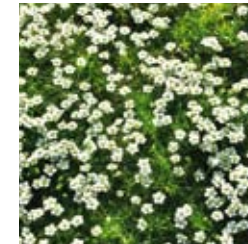
STERNMOOS Sagina subulata weiß, bodenbegrünende Staude, trittfester Rasenersatz