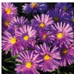
KISSEN-ASTER Aster dumosus 'Augenweide' violettblau, kompakter Wuchs ☼ Sept.-Okt. ↑ 30 cm