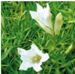
HERBST-ENZIAN Gentiana sino-ornata 'Bellatrix' weiß, Kronzipfel blau gepunktet, großblumig