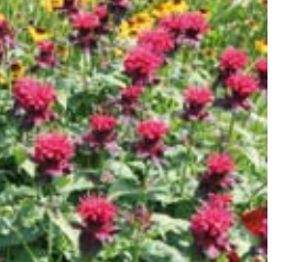
INDIANERNESSSEL Monarda fistulosa 'Fireball®' kräftig rot, gesundes Laub, wertvolle Schnittstaude ☼ Juli-Sept. ↑ 50 cm