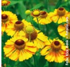
SONNENBRAUT Helenium x hybrida 'Goldrausch' gelb, wertvolle Schnittstaude ☼ Aug.-Sept. ↑ 135 cm