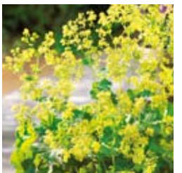
FRAUENMANTEL Alchemilla mollis grünlich gelb, beliebter Flächendecker und Schnittstaude ☀ Juni–Juli ↑ 35 cm