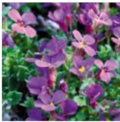
BLAUKISSEN Aubrieta x cultorum 'Blaumeise' violettblau, kompakte Polster, winter-/immergrün