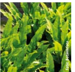
HIRSCHZUNGENFARN Phyllitis scolopendrium lederartiges dunkelgrünes Blatt, ungefiedert, winter-/immergrün ↑ 40 cm