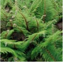
SCHILDFARN Polystichum setiferum 'Proliferum Herrenhausen' lange breite Wedel, winter-/immergrün ↑ 40 cm