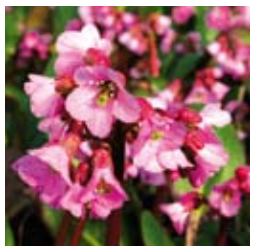
BERGENIE Bergenia cordifolia 'Rosi Klose' purpurrosa, winter-/immergrün, wertvolle Schnittstaude ☀ April–Mai ↑ 30 cm

Dann stehen kniehohe oder gar mannshohe Blütenstauden zusammen mit Blattschmuckstauden in Grüntönen, filigran von Farnen unterbrochen, von nur wenig lichthungrigen Gräsern. Oder es breiten sich dort pflegeleichte Staudenteppiche (sogar immergrün) aus, auf denen tausendfache Blüten von den Jahreszeiten verkünden, in denen sie jetzt gerade erblühen.