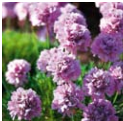
GRASNELKE Armeria juniperifolia 'Röschen' rosa, winter-/immergrün