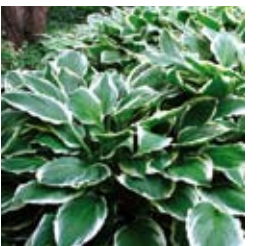
FUNKIE Hosta crispula hellviolett, grünes Blatt mit wei- ßem Rand, langsam wachsend ☀ Juni–Juli ↑ 75 cm