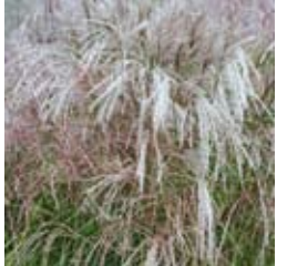
CHINASCHILF Miscanthus sinensis 'Flamingo' silbrigrosa, überhängend, Herbstfärbung, wertvolle Schnittstaude ☼ Sept.-Okt. ↑ 160 cm