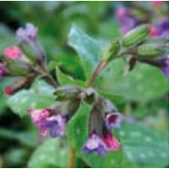
LUNGENKRAUT Pulmonaria saccharata 'Mrs. Moon' rot, bläulich vorblühend, silbrig geflecktes Blatt ☀ April–Mai ↑ 30 cm