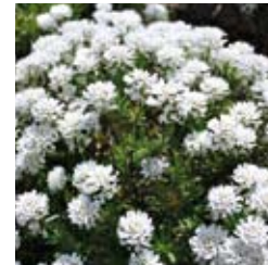
SCHLEIFENBLUME Iberis sempervirens 'Fischbeck' weiß, winter-/immergrün