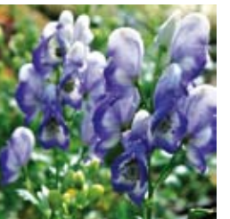
EISENHUT Aconitum x cammarum 'Bicolor' weißblau, wertvolle Schnittstaude ☀ Juni–Aug. ↑ 100 cm