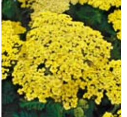
GARBE Achillea filipendulina 'Credo' hellgelb, großblumig, wertvolle Schnittstaude ☼ Juli-Okt. ↑ 120 cm