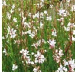
PRACHTKERZE Gaura lindheimeri weiß, schöner Sommerblüher ☼ Juli-Okt. ↑ 100 cm