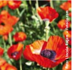
MOHN Papaver orientale 'Beauty of Livermere' tiefrot, wertvolle Schnittstaude ☼ Mai-Juni ↑ 80 cm