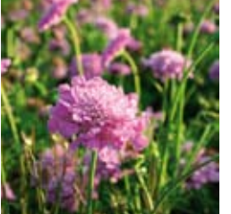
GARTEN-SKABIOSE Scabiosa columbaria 'Pink Mist' rosa, Dauerblüher ☼ Mai-Sept. ↑ 35 cm