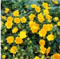
FINGERKRAUT Potentilla crantzii 'Goldrausch' tiefgelb