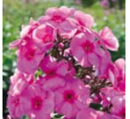
FLAMMENBLUME Phlox paniculata 'Cosmopolitan' rosa, Zwergsorte, wertvolle Schnittstaude ☼ Juli-Sept. ↑ 40 cm